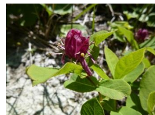
ベニバナヒョウタンボク (6～7月)