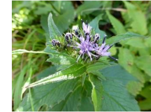
ナガバキタアザミ (7～9月)