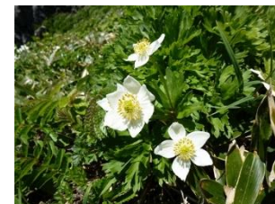
エゾノハクサンイチゲ (6～7月)