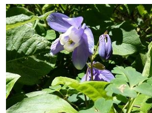
ミヤマオダマキ (6～7月)