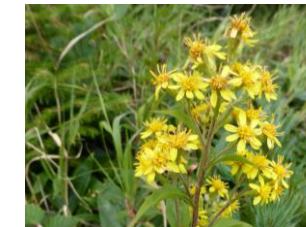
アキノキリンソウ (8～9月)