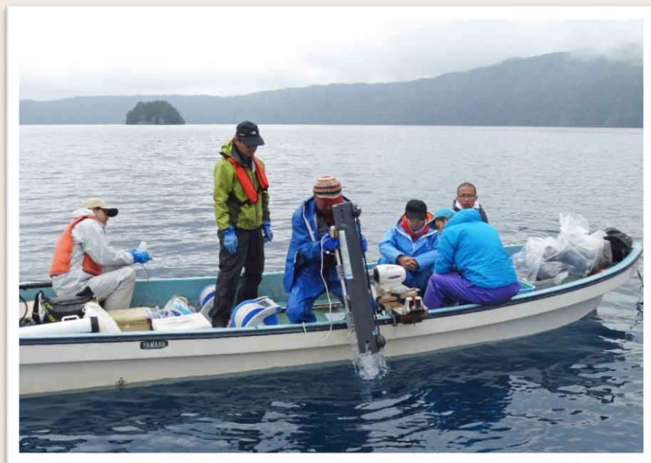
水深210mから採水し分析を行う