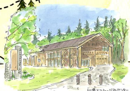
川湯エコミュージアムセンター