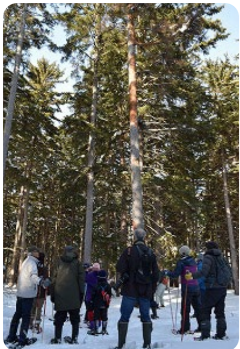
冬はスノーシューで歩きましょう♪

0.7km 0.7km 0.4km 0.4km ① → ③ → ④ → ⑤ → ① 20分 20分 10分 10分