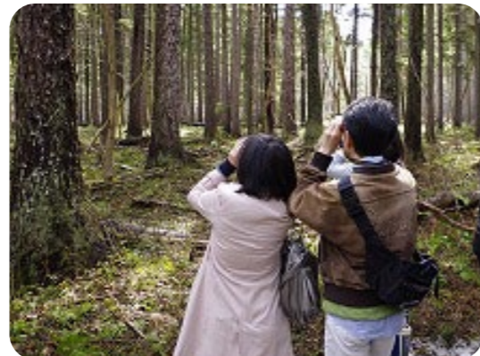
バードウォッチングもおすすめ