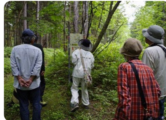
どちらのコースに進みましょう…?