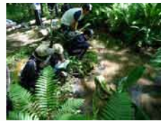
川湯温泉を通る川の源