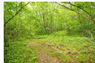
道を間違えないように