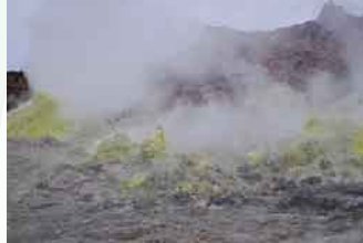
白い噴煙を上げる噴気孔