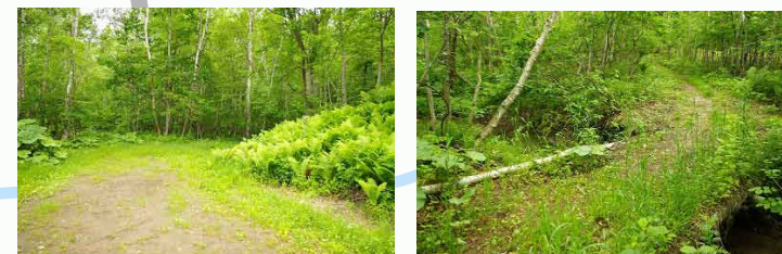
砂利道から小さな橋を渡って散策路へ