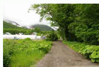
青葉トンネルへ続く道