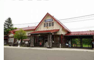
駅からスタートすることもできる