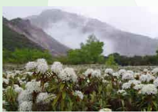
一番早くイソツツジが咲く