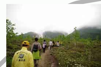
6月はイソツツジ一面のお花畑