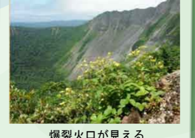
爆裂火口が見える