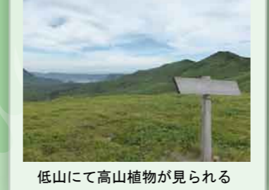
低山にて高山植物が見られる