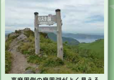
裏摩周側の摩周湖がよく見える