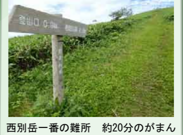
西別岳一番の難所 約20分のがまん