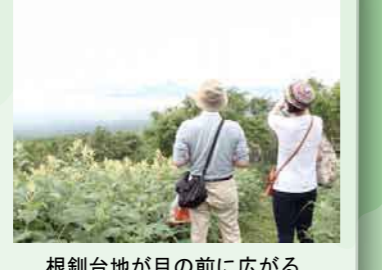
根釧台地が目の前に広がる