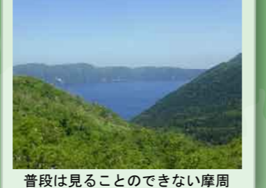
普段は見ることのできない摩周