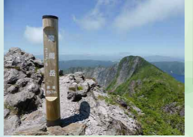
足元には摩周湖と爆裂火口が！