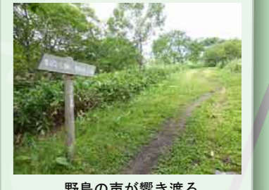
野鳥の音が響き渡る