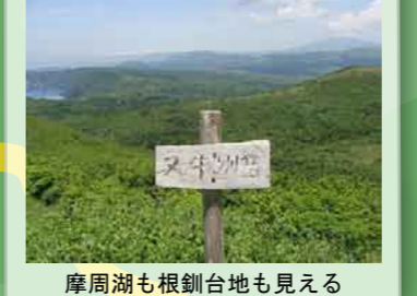
摩周湖も根釧台地も見える