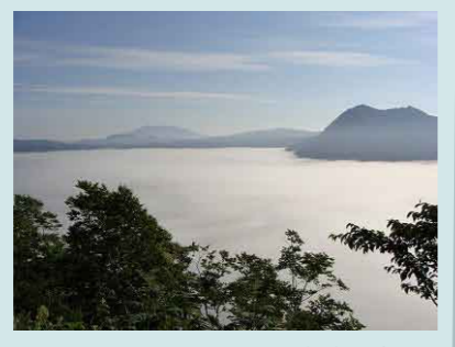
トイレ、レストハウスで休憩できる