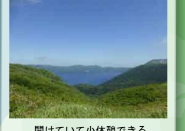
開けていて小休憩できる