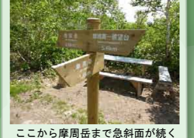
ここから摩周岳まで急斜面が続く