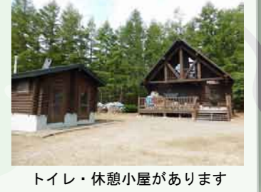
トイレ・休憩小屋があります