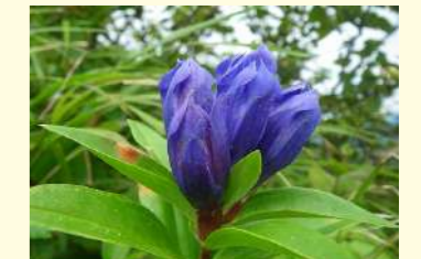
エゾオヤマリンドウ (9～10月)