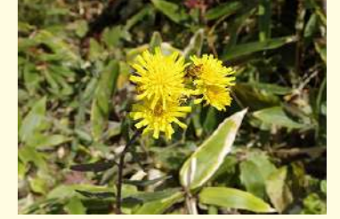
ヤナギタンポポ (8～9月)