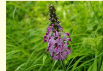
ヨツバシオガマ (6～8月)