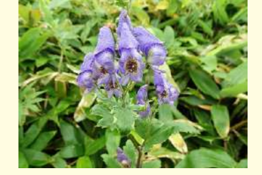
エゾトリカブト (8～9月)