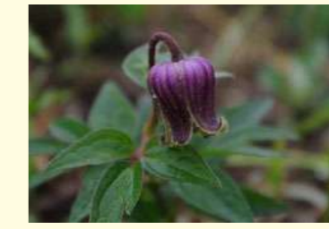
クロバナハンショウヅル (6～8月)