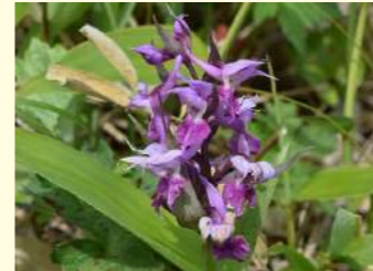
ハクサンチドリ (6～7月)