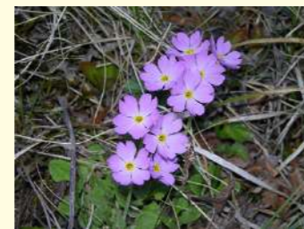
ユキワリコザクラ (5～6月)