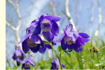
ミヤマオダマキ (6～8月)